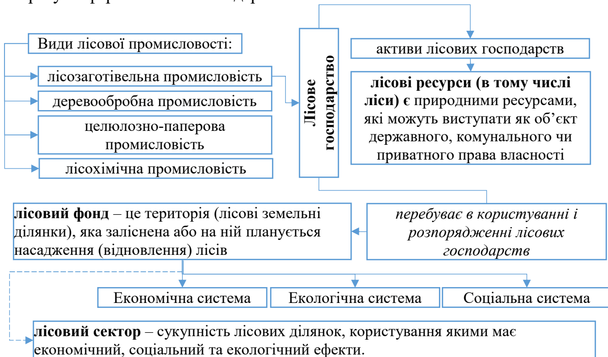
Рис. 3. Понятійно-категоріальний апарат в сфері лісового господарства*

На рис. 3 представлено авторське бачення понятійно-категоріального апарату в сфері лісового господарства.