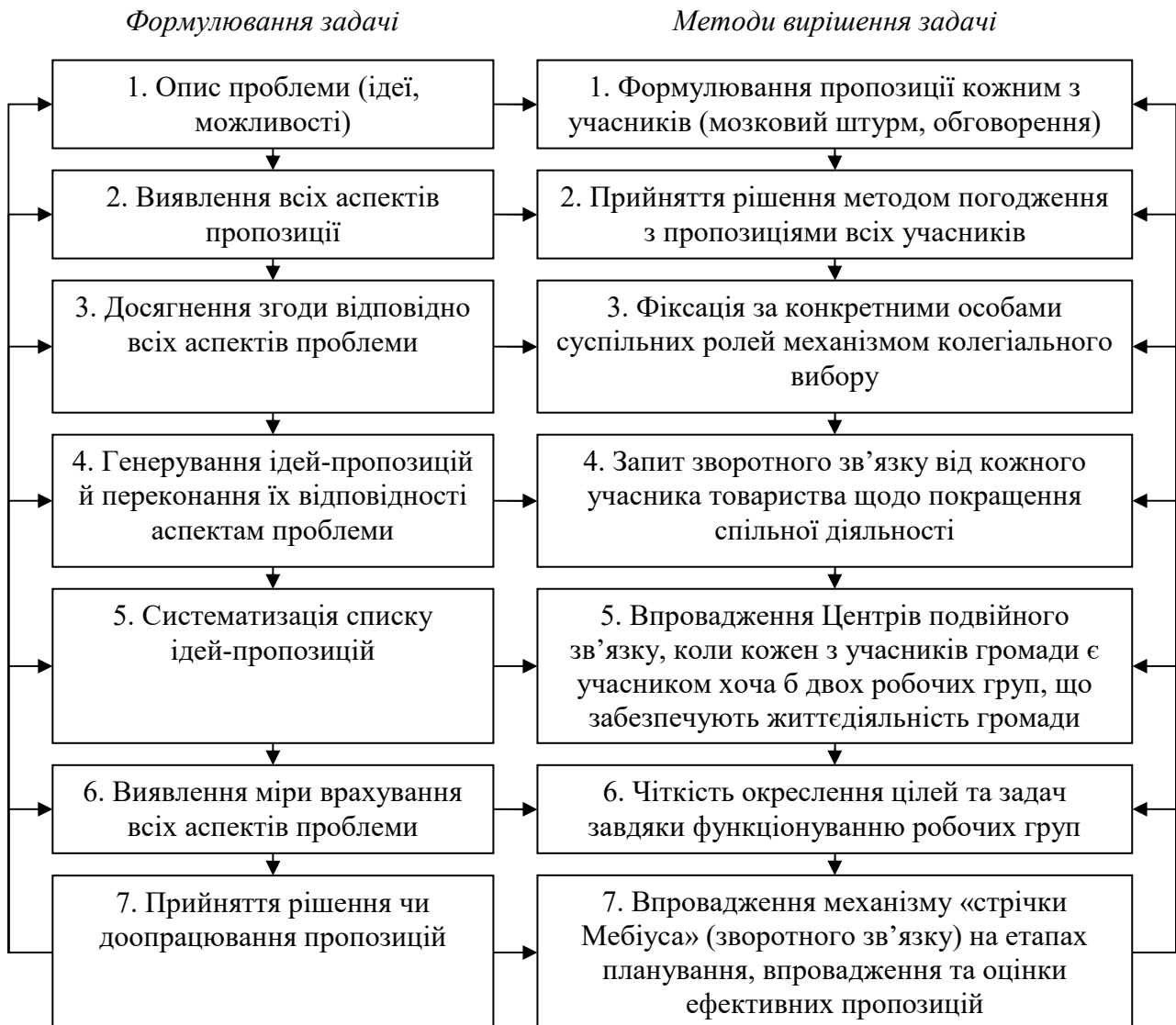
Рис. 2. Алгоритм прийняття колективних рішень методом соціократії

засвідчив його ефективність та здатність до вирішення питань будь-якої складності.