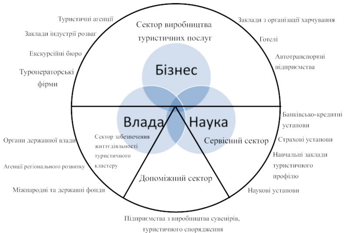
Рис. 1. Організаційна структура регіонального туристичного кластеру

У складі кожного кластеру повинна діяти юридична служба, котра дає можливість забезпечити комплексне юридичне обслуговування і постійний контроль за господарською діяльністю кластеру в цілому. Доцільно буде ввести до складу кластера структуру, яка б забезпечувала маркетинговий супровід діяльності туристичних підприємств, розробляла б рекламну програму. Важливо те, що об'єднання багатьох компаній однієї спеціалізації дасть можливість учасникам кластеру досить ефективно відстоювати свої інтереси на рівні місцевих органів влади та місцевого самоврядування, а також брати участь у великих інвестиційних програмах.