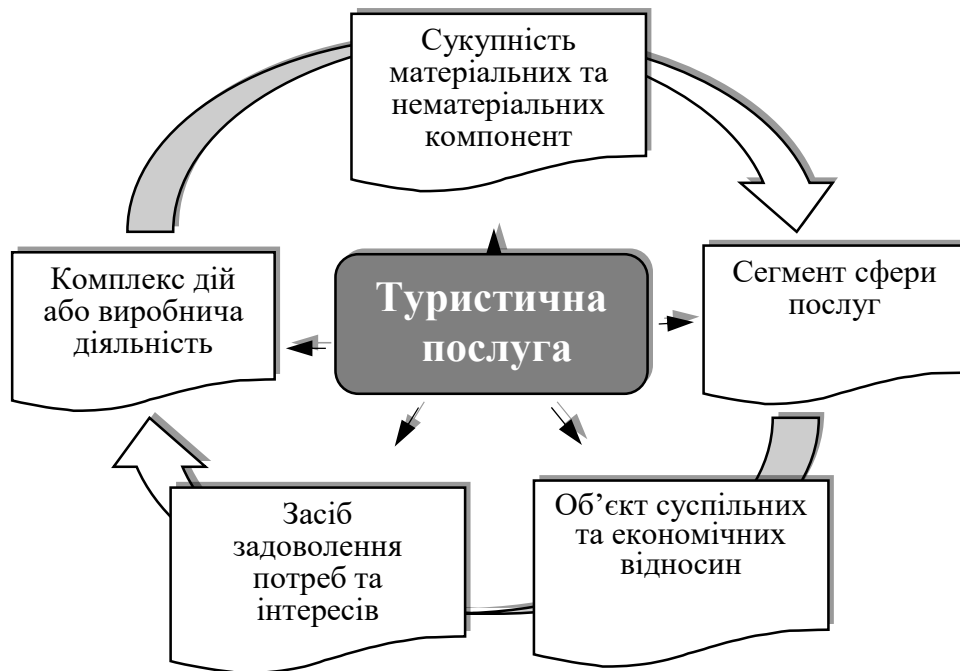
Рис. 2. Типологізація методологічних підходів до трактування сутності категорії «туристична послуга»

Намагаючись сформувавши комплексне визначення, на жаль дослідники тільки обмежують досліджувану категорію до рівня констатації та переліку економічних видів діяльності туристичних підприємств, при цьому вдаючись до помилкової підміни дефініцій (туристичний продукт чи послуга), що інколи суперечить чинним міжнародним та національним вимогам туристичної індустрії.