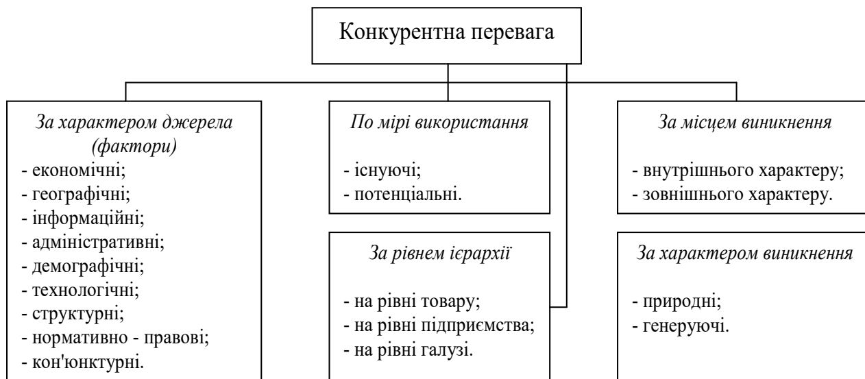
Рис. 2. Класифікація конкурентних переваг

Таким чином, теоретична регламентація і науково обґрунтована класифікація конкурентних переваг є основою управління підприємством в умовах конкурентної боротьби, а застосування розроблених наукових підходів в практичній діяльності сприяє досягненню конкурентоспроможності.