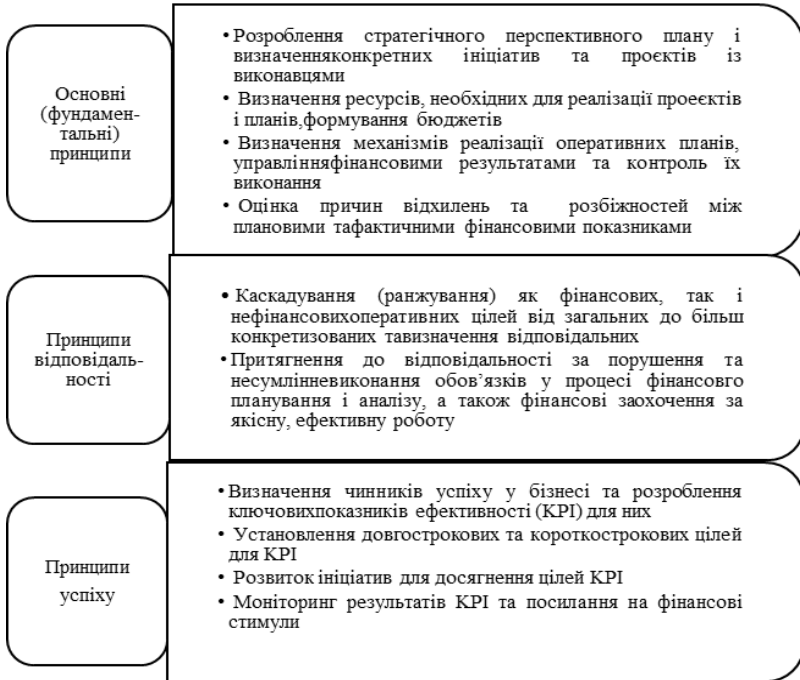
Рисунок 1 – Принципи та етапи побудови процесу фінансового планування і аналізу на підприємстві

фінансової діяльності у майбутньому періоді [2, с. 315].