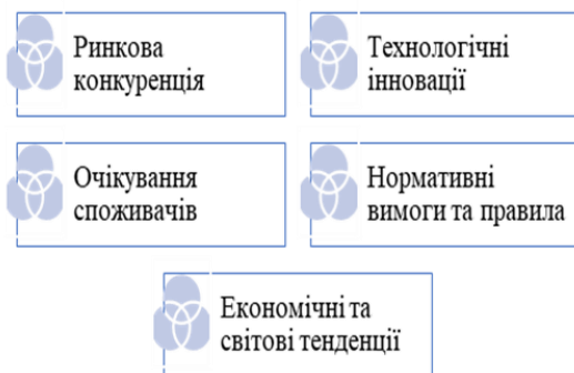
Рис. 1. Фактори екзогенного впливу на цифрову адаптивність підприємства

Екзогенний вплив мають наступні фактори, наведені на рис. 1.