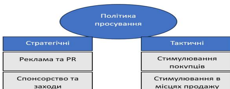
Рис. 1. Напрями формування політики просування підприємств [1]

Не дивлячись на виклики, стратегічні інструменти політики просування, спрямовані на довгостроковий розвиток підприємства зберігають свою актуальність, а тактичні використовуються для швидкого реагування на зміни, що відображається у конкретних цілях у короткостроковій перспективі [1]. На рис. 1 виокремлено основні напрями формування політики просування.