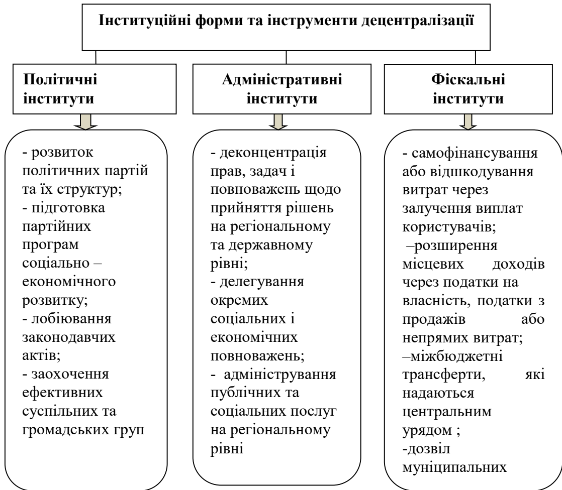
Рис. 2. Форми та інструменти децентралізації

Побудова дієвого інституційного забезпечення соціально-економічного розвитку у контексті процесів децентралізації повинна базуватися на гармонійному поєднанні таких складових (рис. 2.), функціонування яких в Україні на поточному етапі знаходиться на стадії поступового впровадження.