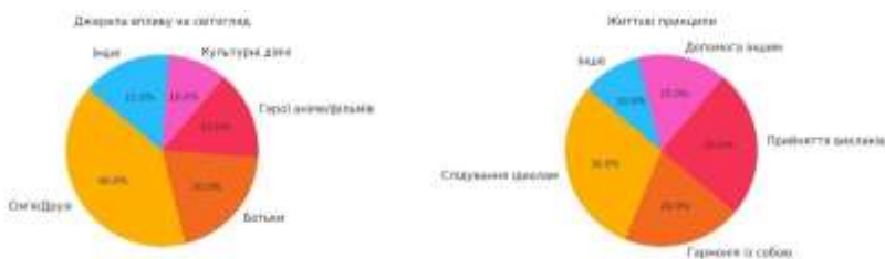
Рис. 1. Джерела впливу на світогляд та життєві принципи

згадують Олександра Усика, чиї стійкість і дисципліна стали джерелом натхнення. 15% респондентів відносять себе до категорії «інше», зазначаючи різноманітні джерела натхнення, наприклад, філософів або суспільних діячів. Загалом відповіді свідчать, що найбільший вплив на молодь мають ті, хто безпосередньо присутній у їхньому житті, з акцентом на родинні зв'язки та емоційні стосунки.