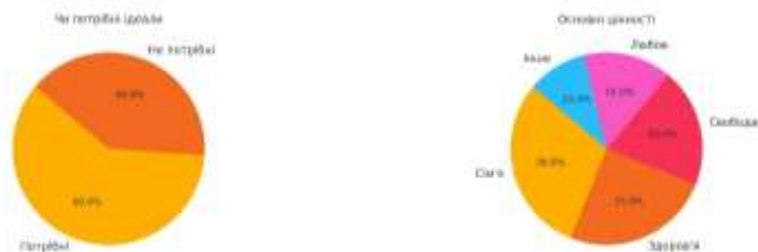
Рис. 2. Ідеали та ранжування основних принципів

Більшість студентів (60%) вважають, що ідеали потрібні, оскільки вони формують життєвий напрямок і надихають на розвиток. «Мати ідеали потрібно, бо вони тримають напрямок у житті та мотивують розвиватися».