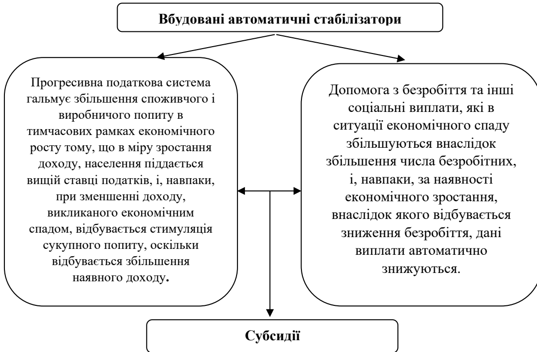
Рис. 2. Вбудовані підтримуючі економічну стабільність стабілізатори, що спрацьовують на основі саморегуляції

Недискреційне фіскальне регулювання базується на автоматичному зростанні чистих надходжень податків до держбюджету в умовах, коли ВВП зростає, що стабілізує вплив на національну економіку.