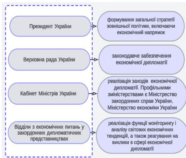
Рис.1. Національні інституції та їх функції в процесі реалізації економічної дипломатії, побудовано на основі [1, 2, 3]

У 2021 році, як показано на рис. 2, експорт збільшився до 2,224,704 млн грн. Це зростання було зумовлене підвищенням попиту на українську продукцію та сприятливішими умовами зовнішньої торгівлі. Проте, у 2022 році, наслідки війни значно вплинули на економіку, спричинивши суттєве зниження як номінального ВВП, так і експорту товарів та послуг. У 2023 році відбулося незначне відновлення експорту, який у підсумку досяг рівня 1,868,904 млн грн. [10].