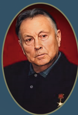
Федір Трохимович Моргун