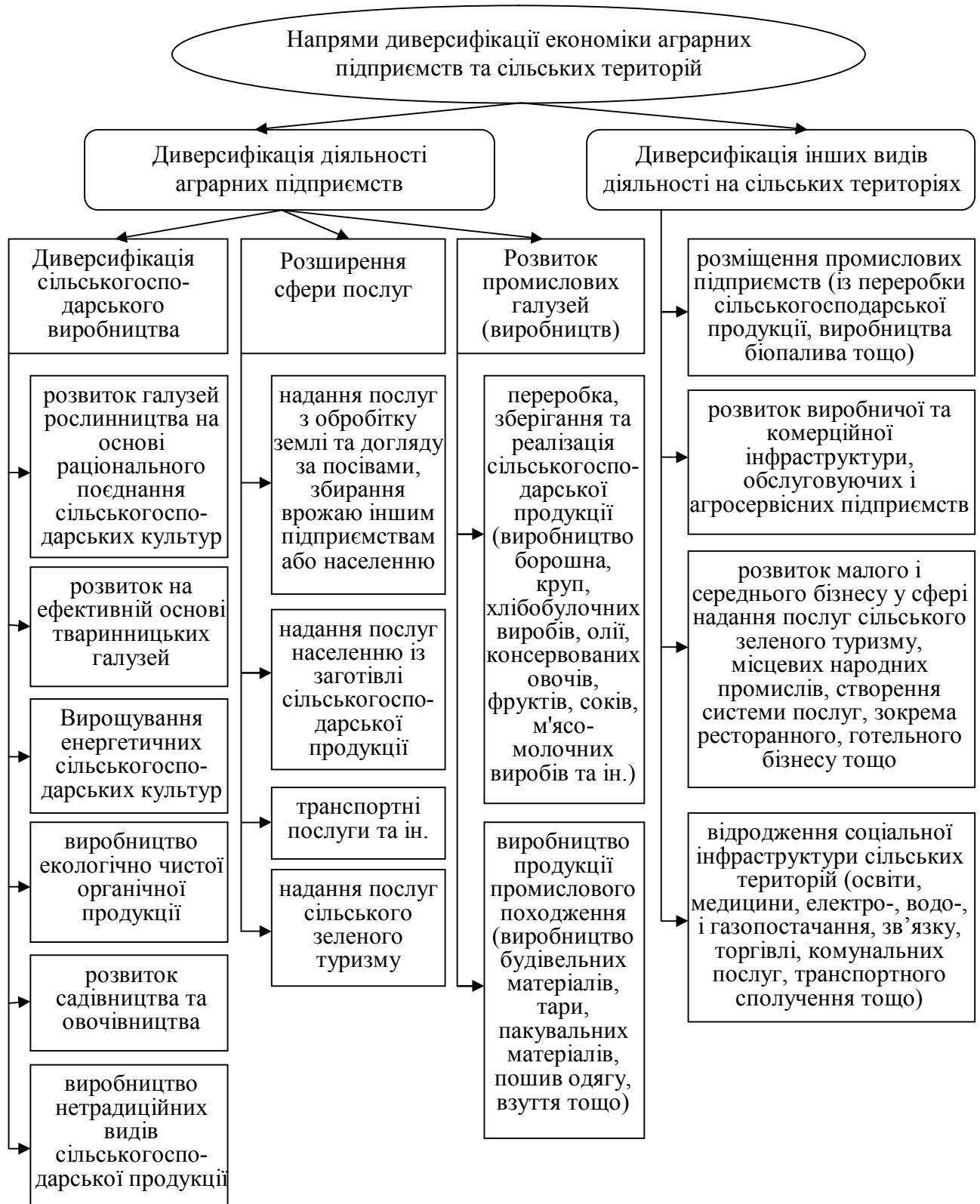
Рис. 1. Напрями диверсифікації економіки аграрних підприємств та сільських територій з урахуванням імплементації туристичних послуг

прийняття управлінських рішень, процесний підхід і контролінг, визначення центрів відповідальності та впровадження інновацій. Вагоме значення має державно-приватне партнерство у цій сфері та співпраця з сільськими громадами й неурядовими організаціями, приватними інвесторами та волонтерами.