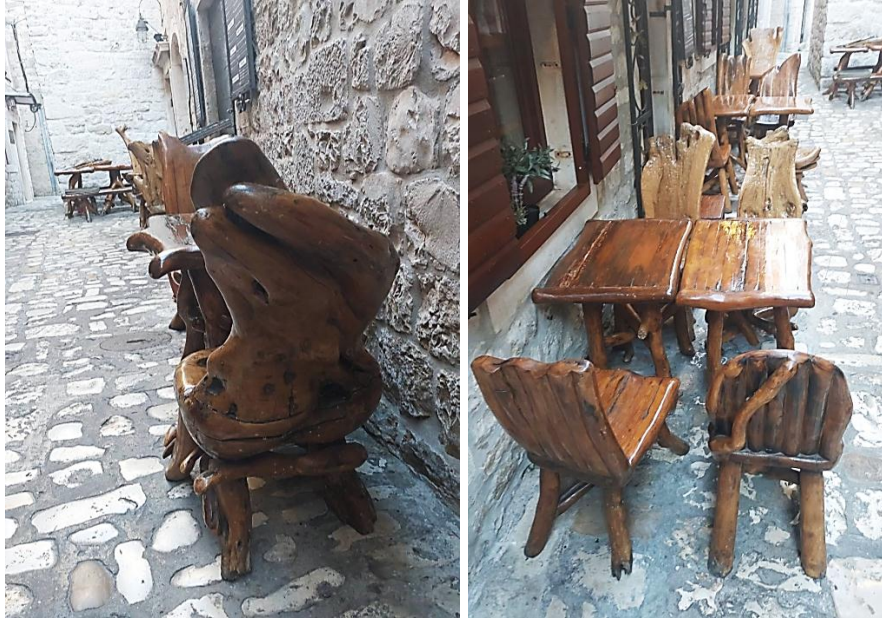
Рисунок 2 – Комплекти меблів для закладу громадського харчування, створені на основі деревинних відходів

Історія масивної деревини в меблях сягає стародавніх цивілізацій. Єгиптяни, греки і римляни використовували масивну деревину в своїх творіннях. У Китаї тисячоліттями для виготовлення імператорських меблів використовувався масив деревини. Довговічність і природна краса деревини зробили її цінним ресурсом з давніх часів.