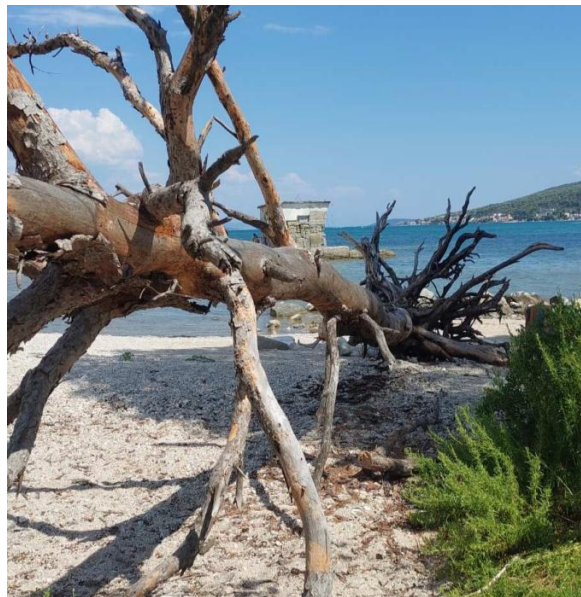
Рисунок 1 – Завалене сухе дерево у прибережній території водоймища

Зазвичай, у лісових насадженнях після заготівлі лісоматеріалів залишається певна кількість неліквідної деревини. Це гілки, уламки стовбурів дерев тощо (рис. 1).