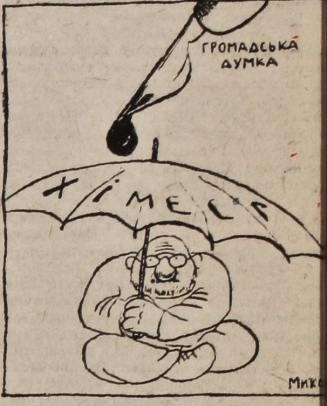
Під теплим крильцем Інституту на Жуганова

України находит необходимым откликнуться на это несчастье, только 1/2% республиканского бюджета (отпущено 100.000.450.000.000), то откуда каждый из нас может отыскать возможность превратить публичку в 187 раз в дату 4.16% от бюджета...» (з заяви Жуганова). Он ви хилите, ми все розуміємо. Вважаємо відповідь і негайну відповідь мусить весь цілком ваш колектив та дирекція.