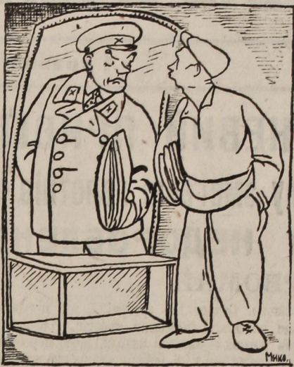
Неваже це я по 4-х роках?

Обстеження ХУМЕСТУ виявило наявність елементів правого ухилу на практиці. Ін-т готував універсала, старого інженера.