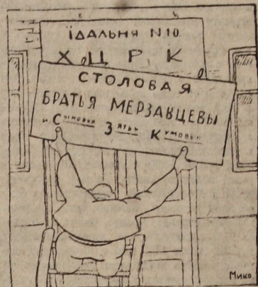
Ей, дядя, руки короткі!

Обсудження студентської Гадальні № 10 виявило бурляві факта сімействостности й кумістства