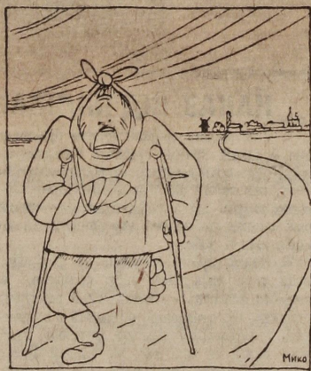
З свіжими силами

За кілька днів перед від'їздом на практику студентам III і III курсів довелось відати по цесляку сальнік Утерьяльськ будиння.