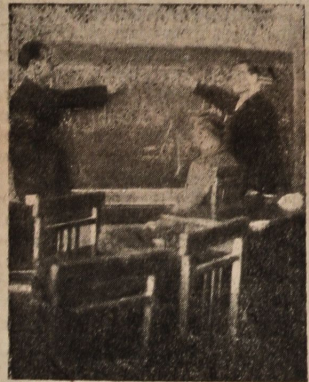
Студентська бригада за роботою