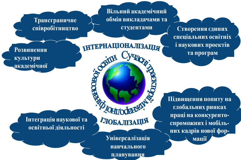
Рисунок 3 – Траєкторії сучасної фінансової освіти

Подібне конструювання освітньо-наукової програми підготовки науково-педагогічних кадрів за спеціальністю 072 «Фінанси, банківська справа та страхування» дозволяє вирішити комплекс проблем, пов'язаних із реальним запровадженням компетентнісного підходу, розвиненням культури академічної автономії, ступеневої та кредитної мобільності, і забезпечує реалізацію процесів інтернаціоналізації та глобалізації в межах сучасних траєкторій міжнародної фінансової освіти (рис. 3).