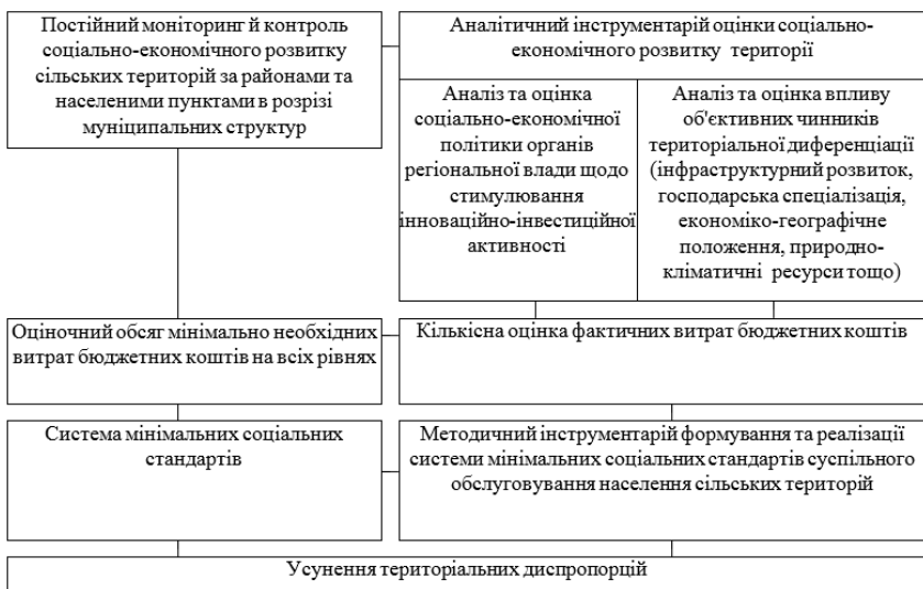
Рис. 1. Регіональний механізм подолання територіальних диспропорцій соціально-економічного розвитку сільських територій

Пріоритетними напрямками застосування інноваційних технологій й техніки з метою активізації соціально-економічного розвитку села є такі: