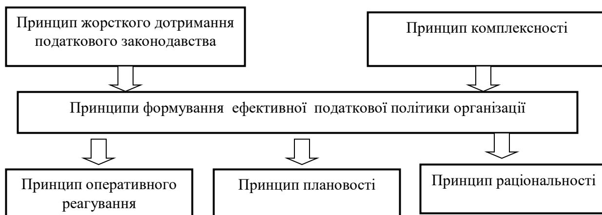
Рис. 1. Принципи формування ефективної податкової політики організації

Основні принципи формування ефективної податкової політики організації представлені на рис .1.