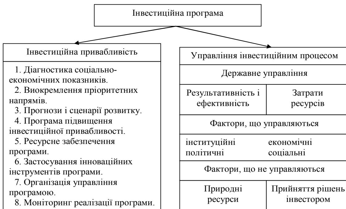
Рис. 4. Макет комплексної програми по залученню інвестицій

Станом на 1 січня 2017 р. в аграрній сфері економіки України підприємства загалом реалізували 380 інвестиційних проектів, що на 82 проекти (27,5 %) більше порівняно з відповідною датою 2016 р. Найбільшу кількість інноваційно-інвестиційних проектів впроваджують агроформування у: Львівській – 48 од. (+ 30 од. або у 2,6 разів більше в порівнянні із 2016 р.); Вінницькій – 45 од. (+ 3 од. або 7,1 %); Черкаській – 43 од. (+ 18 од. або 72,0 %); Полтавській – 40 од. (+ 31 од. або в 4,4 разів більше) та Херсонській – 39 од. (+ 4 од. або 11,4 %) областях. Загальна сума кошторисної вартості інвестиційних проектів становила майже 27,9 млрд. грн., з яких основним джерелом фінансування були власні кошти – 19,2 млрд. грн. або 68,8 %. Вартість інвестиційних проектів, що реалізуються у регіонах, коливається від 80,0 тис. грн. до 9,6 млрд. грн. У порівнянні з даними станом на 01.01.2016 р., загальна сума кошторисної вартості інвестиційних проектів зменшилася на 2,8 млрд. грн. Зокрема, власні та залучені кошти зменшилися на 1,3 млрд. грн. і 0,7 млрд. грн. відповідно. Крім того, зменшилася потреба в інвестиціях на 1,1 млрд. грн.