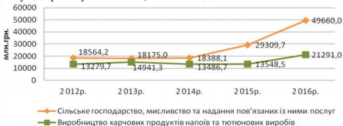
Рис. 1. Обсяги капітальних інвестицій у підприємства сільського господарства та харчової промисловості України у 2012-2016 рр., млн. грн.

реалізована як сировина на зовнішніх ринках. Враховуючи те, що економіка України є відкритою, а значна частина необхідного сучасного обладнання, машин й технологій для агросфери імпортується, доцільно буде провести оцінку реальних капіталовкладень у доларових показниках. Якщо на рис. 1 обсяги інвестицій та зростання продукції розраховані у вартісному вираженні в гривні виглядають досить оптимістично, то на рис. 2, де ці самі показники наведені у доларовому еквіваленті, вони виглядають значно менш вагомо.