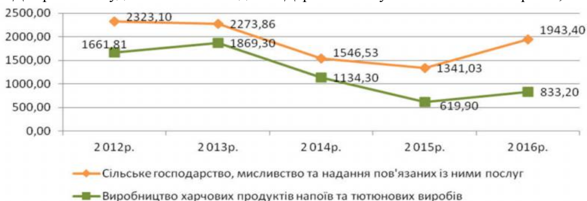
Рис. 2. Обсяги капітальних інвестицій у підприємства сільського господарства та харчової промисловості України у 2012-2016 рр., млн. дол. США

Джерело: побудовано на основі даних Державної служби статистики України, 2017 р.