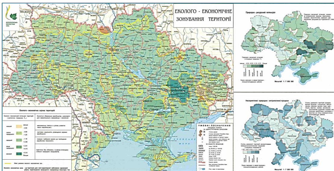
Рис. 5.2. Еколого-економічне районування території.

Протиерозійне районування (зонування) земель. Ерозія ґрунтів є одним із найбільш важливих деградаційних процесів на території України, який негативно впливає на довкілля, спричиняє значні економічні втрати та загрожує існуванню ґрунту як основного засобу сільськогосподарського виробництва і незамінного компоненту біосфери.