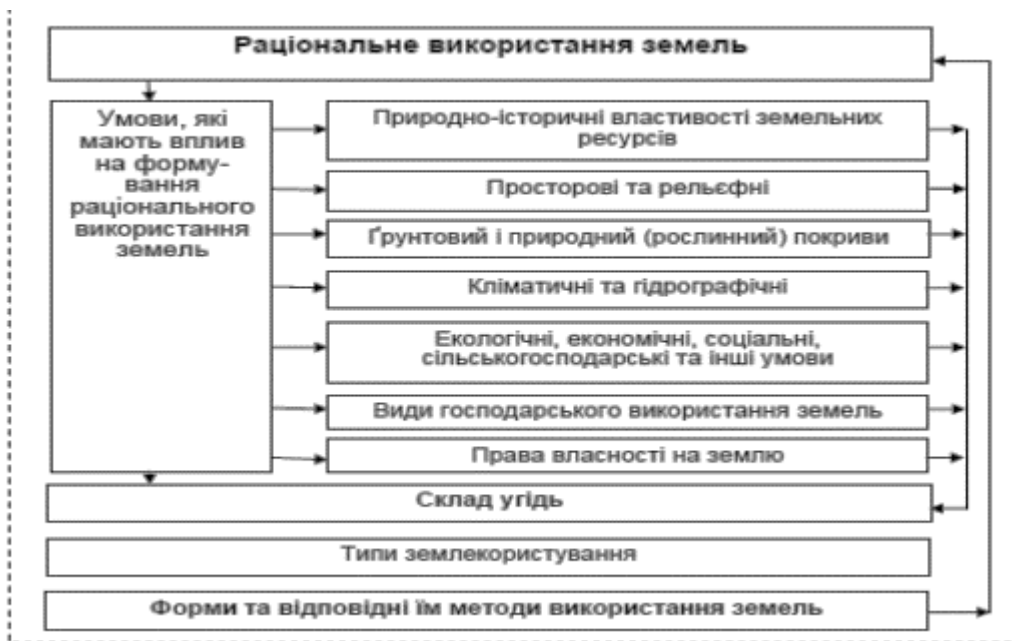
Рисунок 2.2. Логічно-смыслову модель формування раціонального використання земель [5].

При нераціональному використанні землі, залежно від природних умов і характеру господарської діяльності, виникають різноманітні форми її деградації. Серед них: