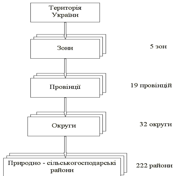
Рис.5.1. Схема природно-сільськогосподарського районування території України

Природно-сільськогосподарська провінція – частина зони, яка відрізняється фаціальними особливостями ґрунтового покриву і збільшенням континентальності клімату (зокрема тривалістю вегетаційного періоду, його тепло- і вологозабезпеченістю, сніжністю зими, наявністю суховійних явищ тощо). Кожній провінції характерний певний набір вирощуваних сільськогосподарських культур і відповідна агротехніка [30].