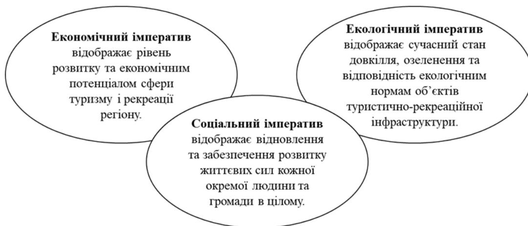
Рис. 1. Імперативи збалансованого функціонування галузі туризму та готельно-ресторанного бізнесу регіону

грн за той же період у 2022 році. У 2021 році ця сума була аналогічною до минулорічної.