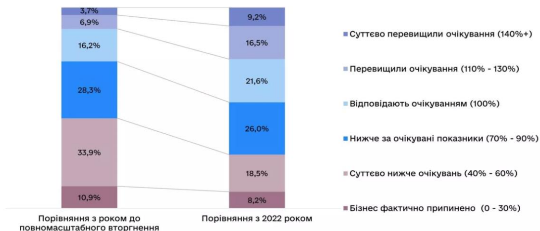
Рис.1. Результати роботи бізнесу у 2023 році порівняно з аналогічним періодом 2022 року [8 ].

змінити напрямок діяльності та навіть стати лідерами на ринку після закінчення кризи. Бізнесу слід усвідомити, що підходи до організації виробництва, просування продукції на ринки та інструменти конкурентної боротьби, які були ефективними кілька років або навіть місяців тому, суттєво змінюються [9].