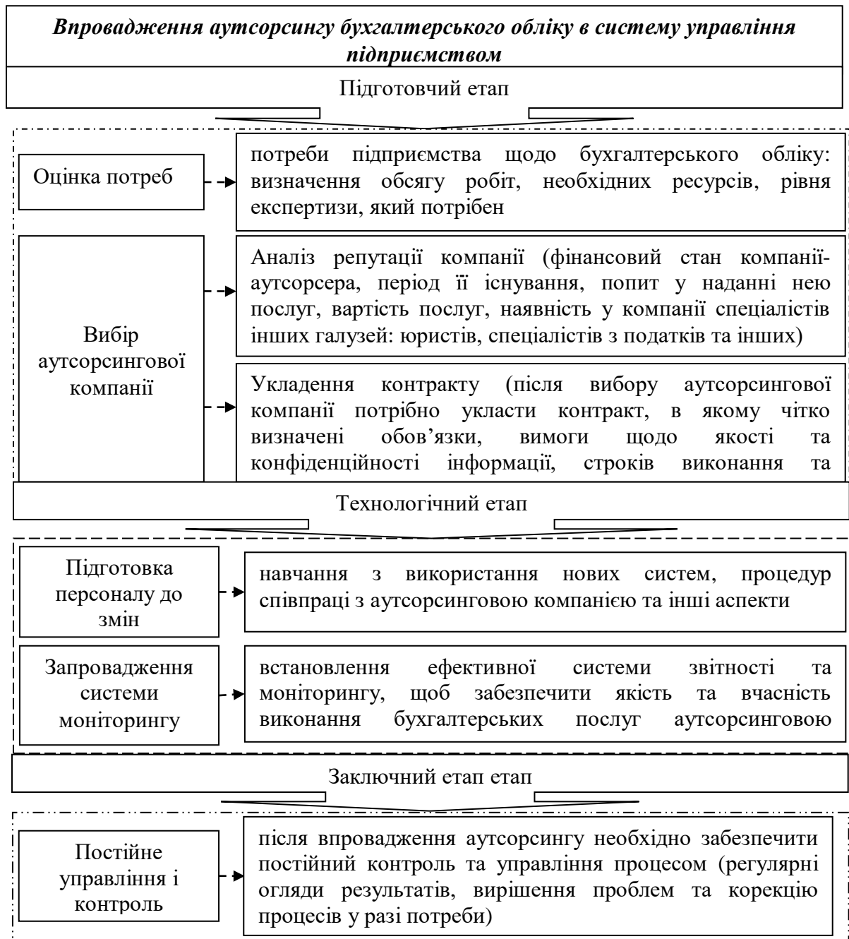
Рис. 3. Схема впровадження аутсорсингу бухгалтерського обліку в систему управління підприємством