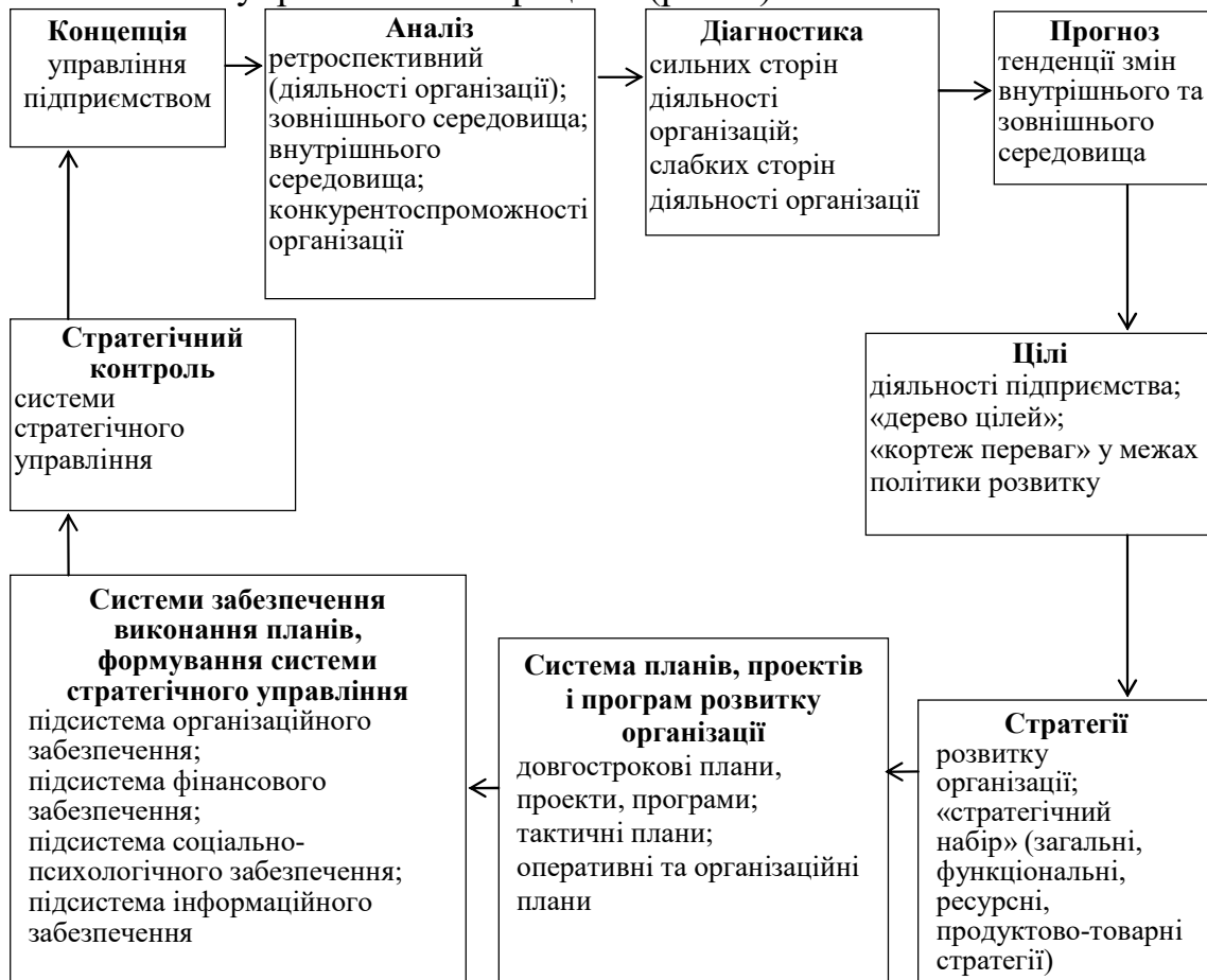
Рис. 1. Концептуальна схема стратегічного управління діяльністю та конкурентоспроможністю підприємств-виробників агропродовольчої продукції

Стратегічне управління можна розглядати як динамічну сукупність взаємопов'язаних управлінських процесів (рис. 1).