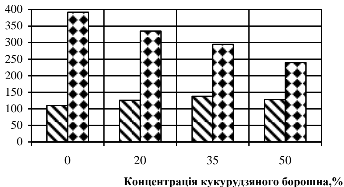
Рисунок 1 – Залежність показників намочуваності та твердості печива від концентрації кукурудзяного борошна: ▨ – намочуваність, %; ▩ – твердість, Па

з 50% добавки, є негативним, оскільки печиво буде надмірно крихким і ламким, а це спричиняє незручності під час пакування та транспортування продукції.