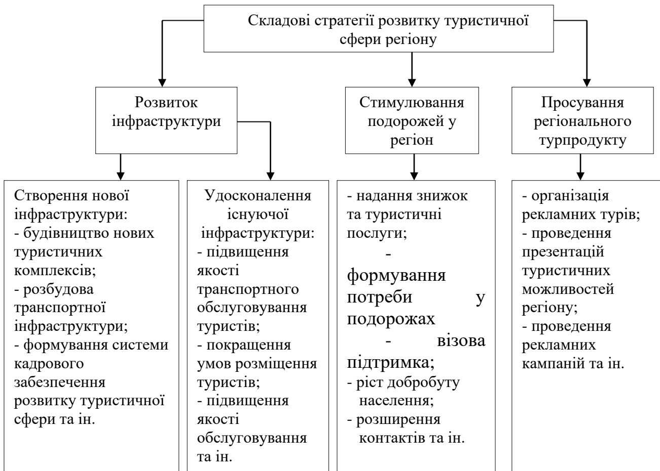
Рис. 2. Складові стратегії розвитку туристичної сфери в регіоні

стимулювання підприємницької активності у туристичній сфері.