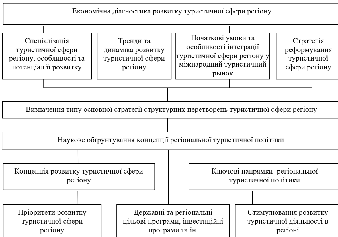
Рис. 4. Розробка регіональної туристичної політики із використанням сценарного підходу

Сценарний підхід до розробки та реалізації туристичної політики регіону передбачає, що на початковому етапі, ґрунтуючись на результатах економічної діагностики розвитку туристичної сфери регіону, здійснюється обґрунтований вибір типу основної стратегії структурних трансформацій туристичного комплексу регіону, якій має відповідати регіональна політика розвитку туризму. Другий етап передбачає встановлення базових завдань, визначення сутності й принципів формування регіональної туристичної політики (рис. 4). Сценарний підхід передбачає, що в умовах ризику й невизначеності сучасної ситуації на туристичному ринку, формування моделі стратегічного розвитку туристичної сфери регіону повинне відбуватися на засадах врахування об'єктивних передумов й прогнозування її розвитку. Це дасть змогу використати весь арсенал методів регулювання для стимулювання розвитку туристичної сфери регіону у передбаченому стратегією напрямку.