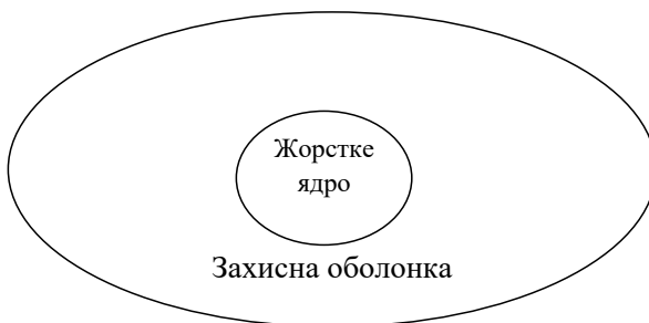
Рис. 2.1. «Жорстке ядро» і «захисна оболонка» неокласичної теорії

Схему епістемологічного аналізу (епістемологія досліджує знання, його будову, структуру, функціонування і розвиток) запропонував Імре Лакатос. Згідно з його поглядами, будь-яка теорія включає дві компоненти - «жорстке ядро» (hard core) і «захисну оболонку» (protective belt).