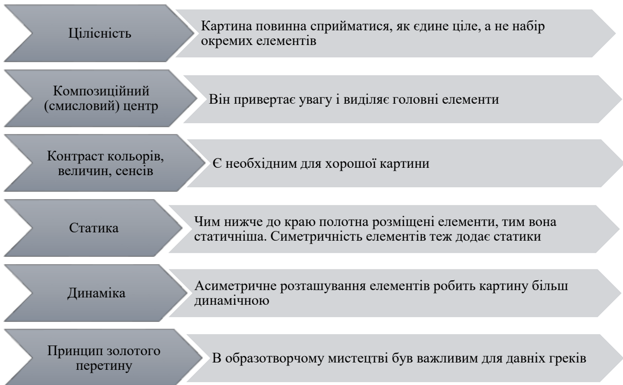
Рис. 1. Правила композиції

Щоб створювати гармонійні картини, необхідно знати також композиційні прийоми, серед яких виділяють сім, які представлені на рисунку 2.