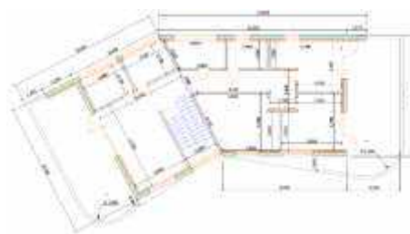
Рис.3 – план 2 поверху

Кімнати та їх розташування. Всього у будинку 15 кімнат (4 спальні кімнати, 3 ванні кімнати, 2 комори, 2 гардеробні кімнати, котельня, кухня суміщена з вітальнею, передпокій, робочий кабінет), 2 балкони та 2 тераси.