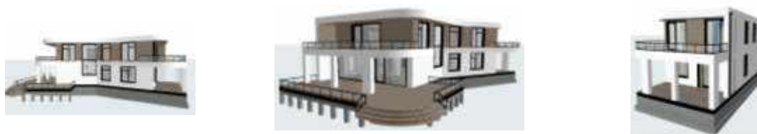
Рис.1 – фото різних фасадів будинку

Розташування та природні умови. Місцем будівництва обрала місто Харків, селище Сокольники. Кліматичний район за фізико-географічними характеристиками – північно-західний. Ґрунти – лесовидний суглинок. Рівень ґрунтових вод на глибині 5 м від поверхні землі, характер – не агресивні. Нормативна глибина сезонного промерзання – 0,9-1 м.