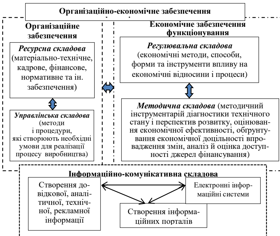
Рис. 1. Комплекс складових і структурних елементів організаційно-економічного забезпечення функціонування підприємства

Комплексна система організації виробництва туристичного продукту називається індустрією туризму, яка об'єднує спеціалізовані підприємства, організації та установи, у комплексі яких головну роль відіграють туристичні фірми виробництва та реалізації туристичного продукту (туристичні бюро – туроператори, туристичні агентства, екскурсійні бюро, бюро реалізації путівок), за безпосередньої участі підприємств, які надають послуги з розміщення, харчування, транспортування, рекламно-інформаційні, виробничі туристичні підприємства, підприємства торгівлі, підприємства дозвілля, заклади самодіяльного туризму, навчальні та науково-проектні туристичні заклади, органи управління туризмом, але це далеко не повний перелік підприємств, організацій установ, які беруть участь у виробництві туристичного продукту. Туристичну індустрію опосередковано формують підприємства зв'язку і торгівлі, дорожні і комунальні служби, прикордонні і митні переходи та багато інших.