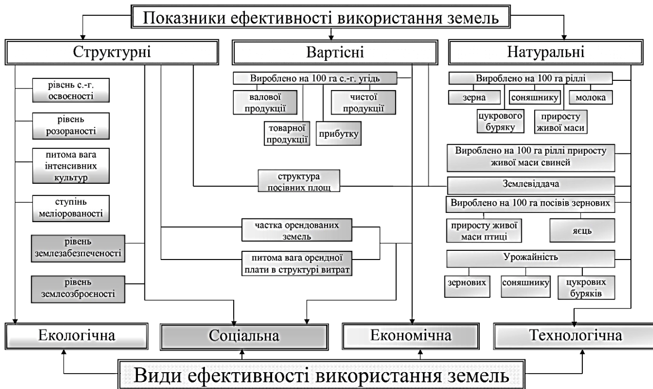
Рис. 1. Схема зв'язку видів з показниками ефективності використання земель

Цей метод було адаптовано для оцінки ефективності використання земельно-ресурсного