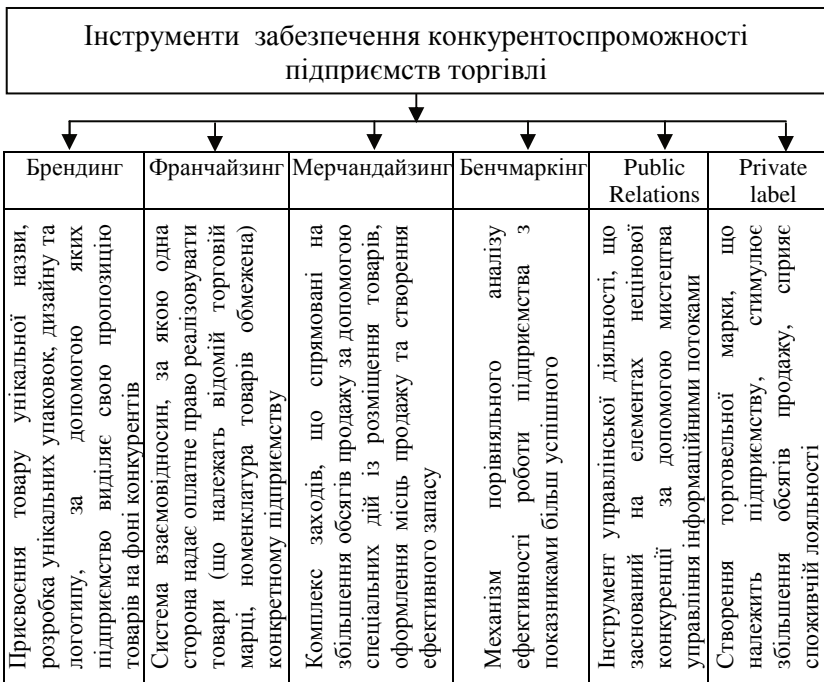
Рис. 2. Інструменти забезпечення конкурентоспроможності підприємств торгівлі

Висновки. Використання комплексного підходу до формування та реалізації системи забезпечення конкурентоспроможності, систематизація методів та показників визначення конкурентоспроможності підприємства дає можливість забезпечити на практиці виявлення та використання існуючого резерву підвищення конкурентоспроможності і опанувати ринкову ситуацію.