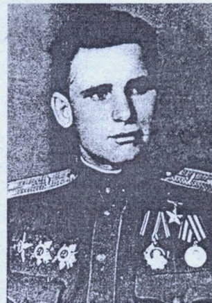
Гапон Г.Є., Герой Радянського Союзу