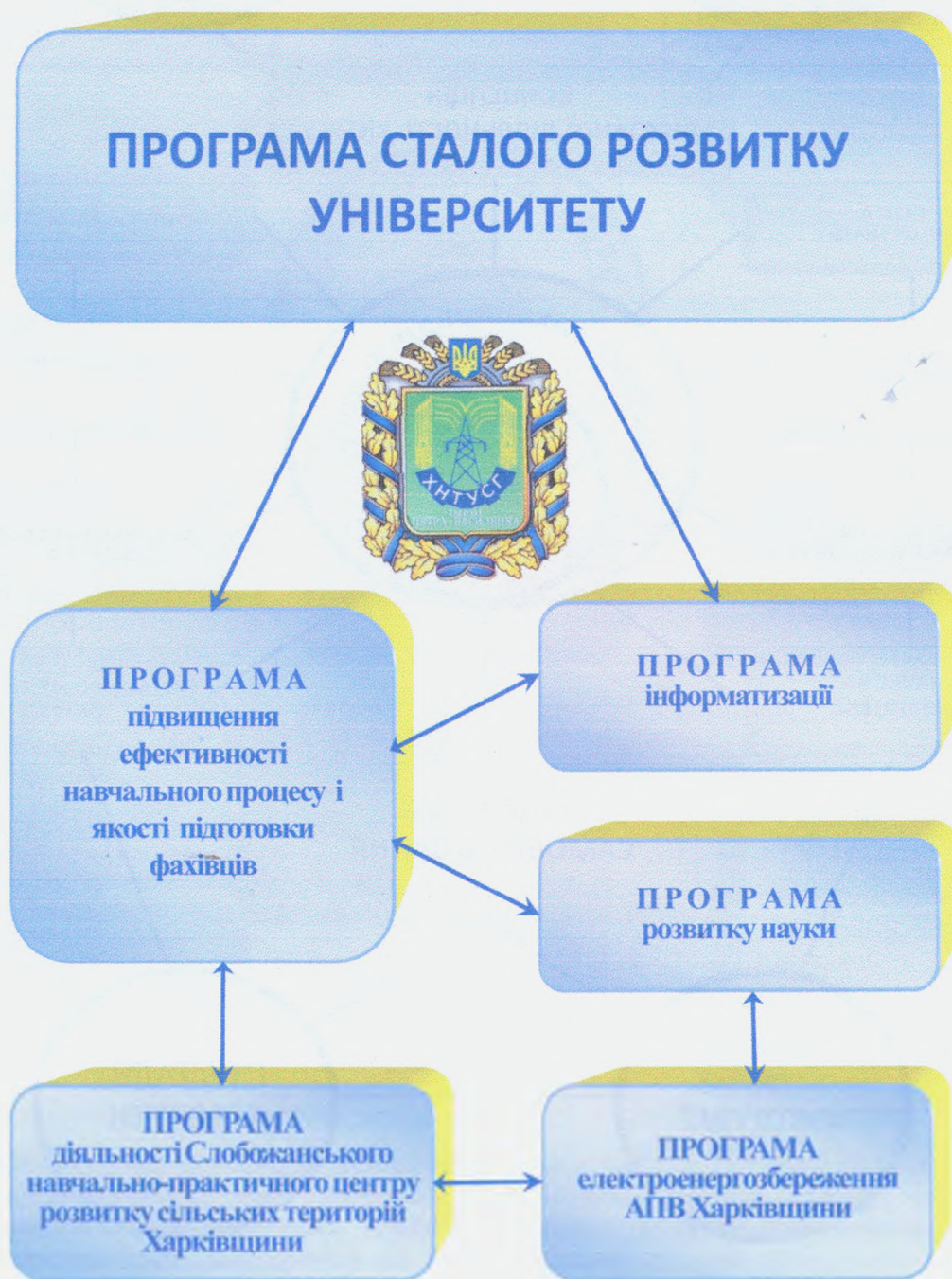
Рис. 4. Інноваційні програми сталого розвитку ХНТУСГ

фінансово-економічного забезпечення; робітничих професій; практик і працевлаштування; виставково-музейний; системи менеджменту якості; організаційно-адміністративний; дистанційного навчання; Слобожанський навчально-практичний центр; правничо-кадровий; ефективності господарювання; спілка випускників; земляцтва студентів; просвітницька рада.