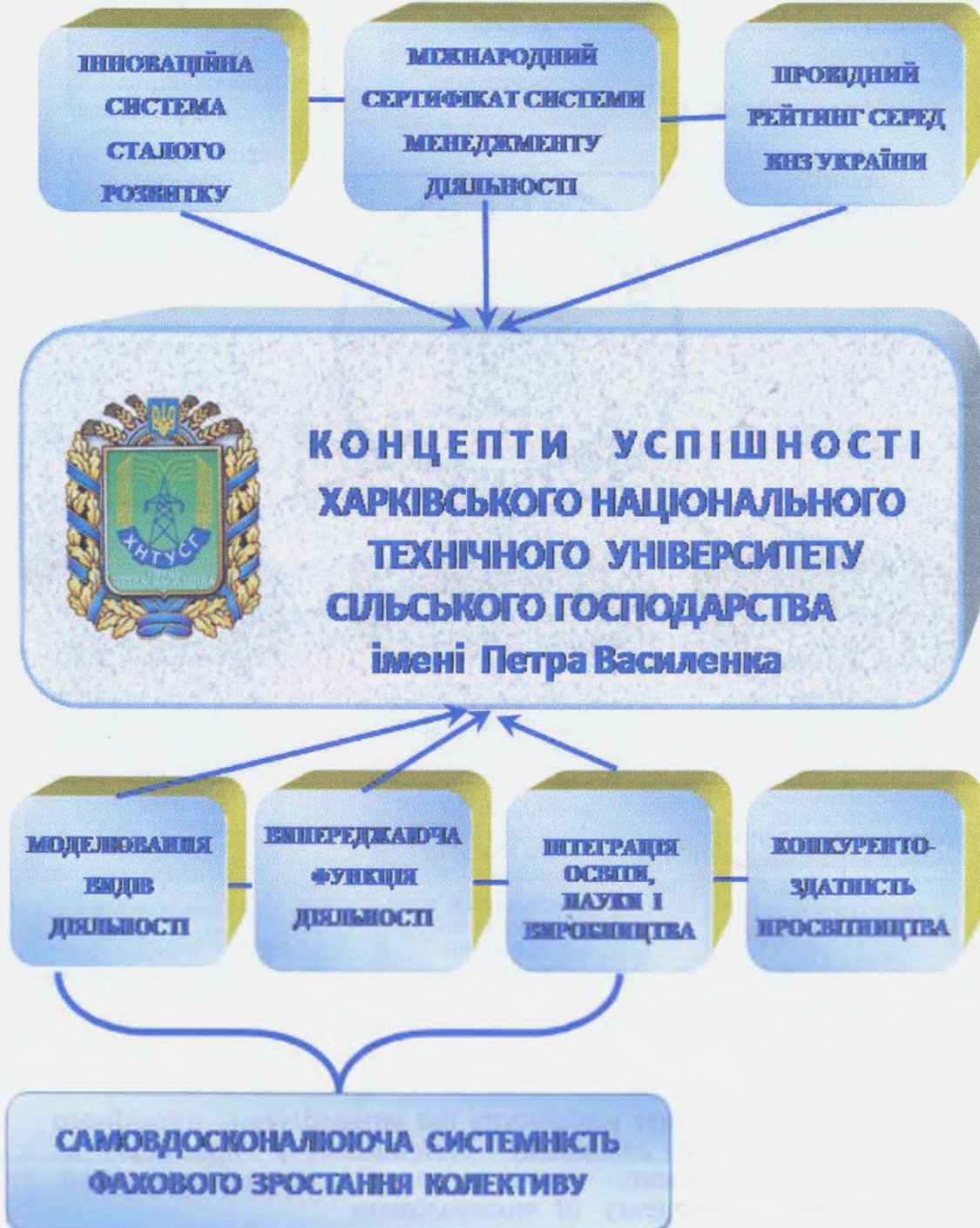
Рис. 1. Визначені концепти успішності колективу

рейтингом ТОП-200 61-66 місця; серед 229 ВНЗ за рейтингом МОН — 6 місце, серед аграрних ВНЗ — 3; 2, а в 2014 р. за консолідованим рейтингом ТОП-200, Scopus, Webometrics — серед 17 аграрних ВНЗ Міністерства агрополітики — 1 місце, серед 32 харківських ВНЗ — 11 місце.