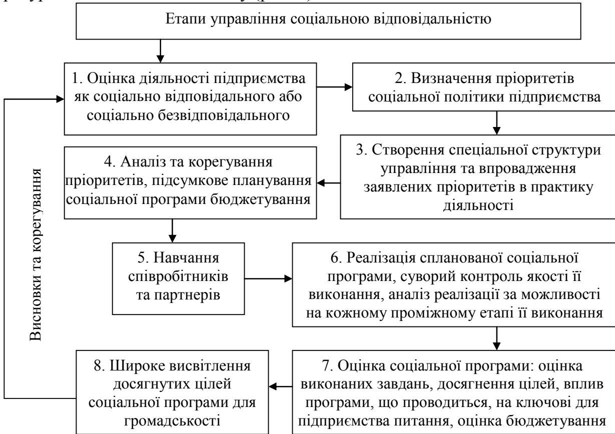
Рис. 4. Етапи та зміст інституційного забезпечення соціальної відповідальності суб'єктів господарювання агросфери з метою підвищення її ефективності

прозорості звітності; інститути державної та суспільної оцінки і схвалення соціальної відповідальності та несприйняття соціального, економічного й ресурсно-екологічного егоїзму (рис. 4).