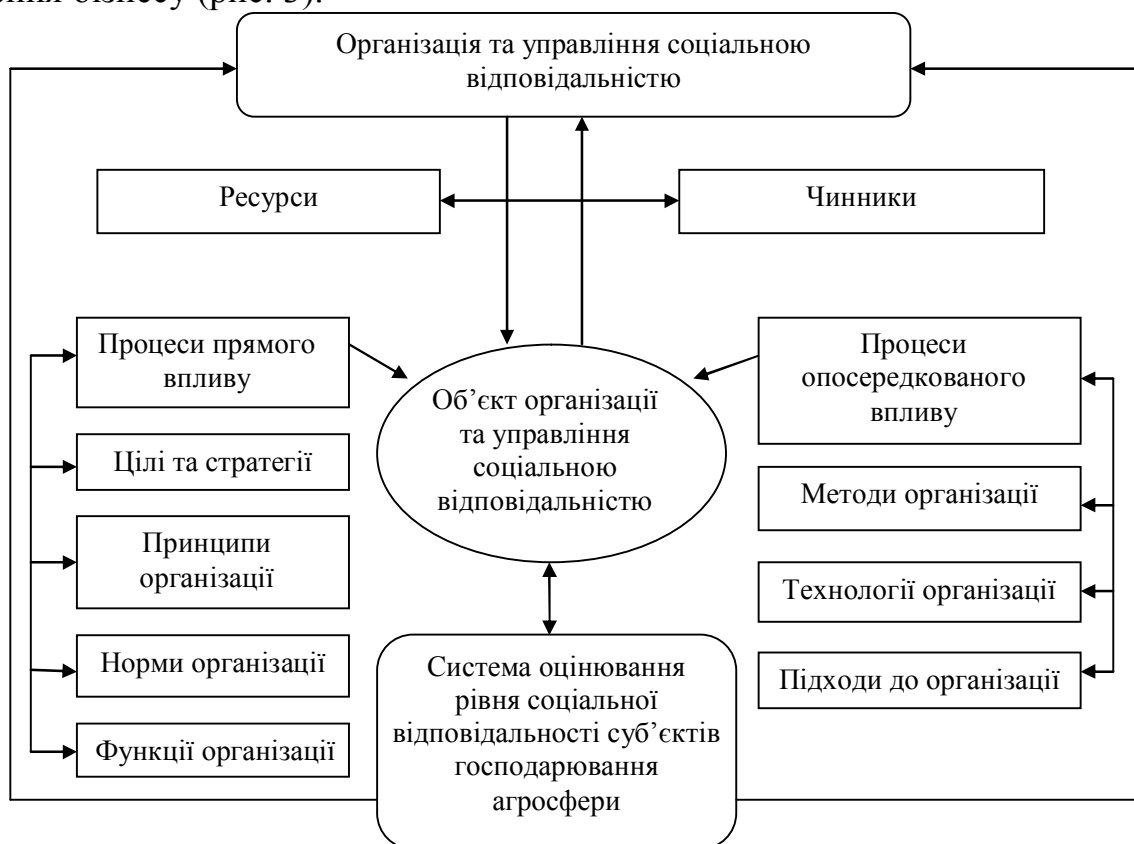
Рис. 3. Організаційно-економічний механізм та управління соціальною відповідальністю суб'єктів господарювання агросфери

Обґрунтовано, що удосконалення організаційно-економічного механізму СВ означає збільшення її напрямів та сфер прикладання, уніфікація форм, розширення номенклатури соціальних заходів, сукупності програм та проектів, розробку моделей для аграрних та переробних підприємств у відповідності до їх галузевої (підгалузевої) спеціалізації, розмірів та масштабів діяльності, наявності фінансових та інших джерел і ресурсів, етапів та завдань циклів розвитку, національних, регіональних проблем, які потребують пріоритетного вирішення та проблем громад і територій безпосереднього розміщення або ведення бізнесу (рис. 3).