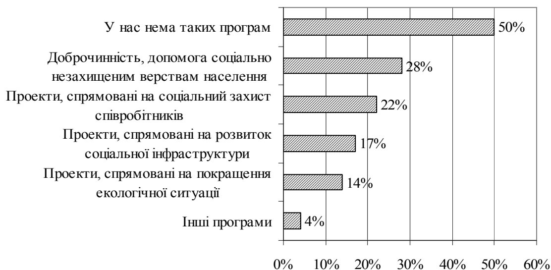
Рис. 5. Соціальні програми вітчизняних аграрних підприємств та їх спрямування (за результатами опитування)

Повною мірою продовольча спеціалізація аграрних і переробних підприємств у плані соціальної відповідальності могла б проявитися шляхом їх участі у державних та місцевих продовольчих програмах. Очевидно, що є необхідність їх участі, поряд з мережами громадського харчування та торгівельними мережами, у програмах продовольчого спрямування – шкільного харчування, лікарняного, військового продовольчого забезпечення, які мають досить невеликі бюджети. Виробництво харчових продуктів пов’язане із значними відходами, великими обсягами використання тари і пакувальних матеріалів, водозабезпеченням. Тому велике значення має соціальна відповідальність через участь у розробці державних програм з безвідходного виробництва, утилізації відходів, зворотного водокористування та енерго- і ресурсоощадності в цілому. Це допомогло б значно розширити існуючу практику соціальної відповідальності, яка має значні резерви для удосконалення саме у визначених напрямках (рис. 5).