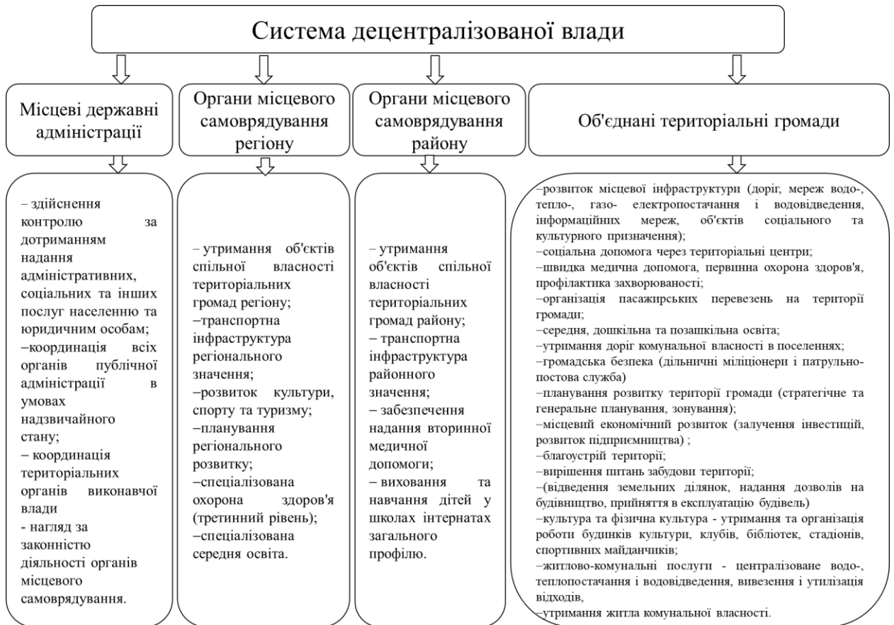
Рис. 2. Функціональні обов'язки інституцій децентралізованої влади

Сталий розвиток громад передбачає тісну співпрацю представників влади, населення та бізнесу, які не можуть діяти у розриві одне від одного, а тільки спільними зусиллями вирішувати спільні завдання і забезпечувати економічне зростання громади та підвищення рівня життя населення.