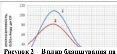
Рисунок 2 – Вплив бланшування на активність ферментів гарбуза: 1 - поліфенолоксидаза; 2 - пероксидаза

ми було встановлено, що при обох видах теплової обробки відбувається її руйнування. Але у порівнянні з бланшуванням втрати аскорбінової кислоти при паротермічній обробці протягом 30 хвилин в два рази менші і становлять 30 % у порівнянні з 60 % при бланшуванні. Що стосується каротиноїдів, то для обох видів теплової обробки було встановлено збільшення вмісту протягом перших 10 хвилин, яке при паротермічній обробці є більш суттєвим і становить 2,5...3,5 рази, при бланшуванні - 1,5...2,0 рази. Після цього масова частка каротину в продукті практично не змінюється.