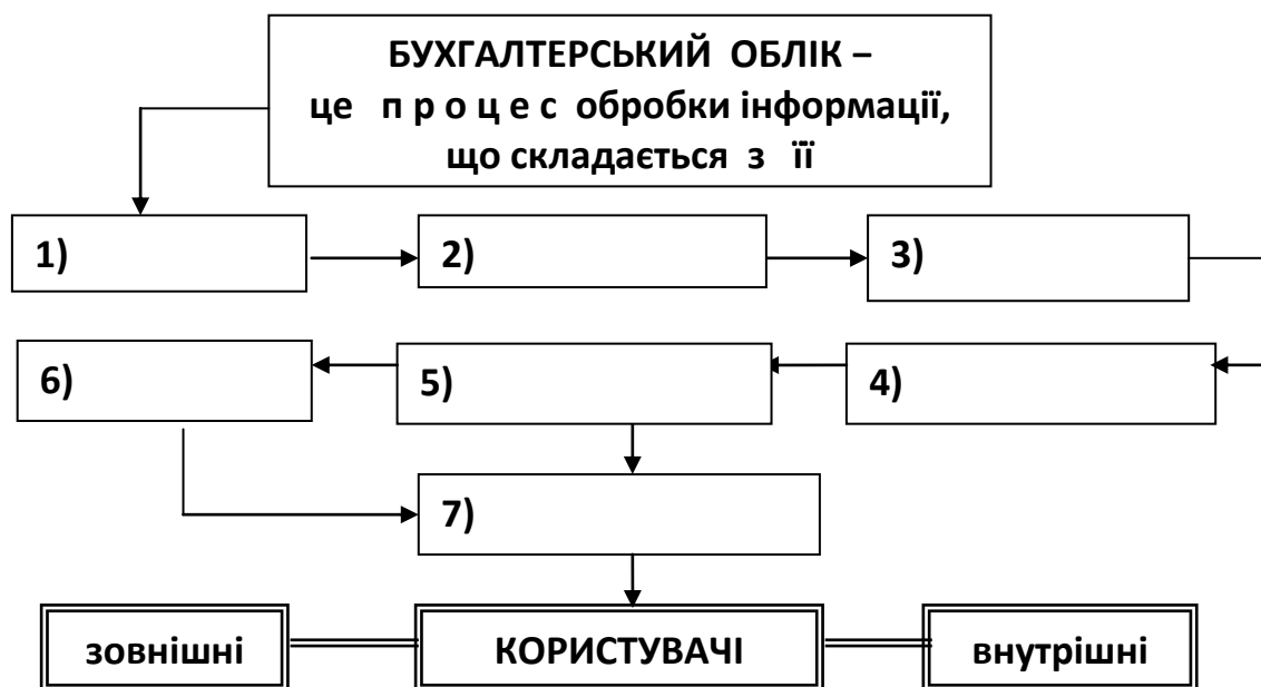
Рис. 1.1 – Складові визначення бухгалтерського обліку як процесу

До схеми (рис. 1.1) внести та розташувати у логічній послідовності необхідні складові (узагальнення, вимірювання, накопичення, виявлення, передавання, зберігання, реєстрації), за допомогою яких бухгалтерський облік можна визначити як процес.