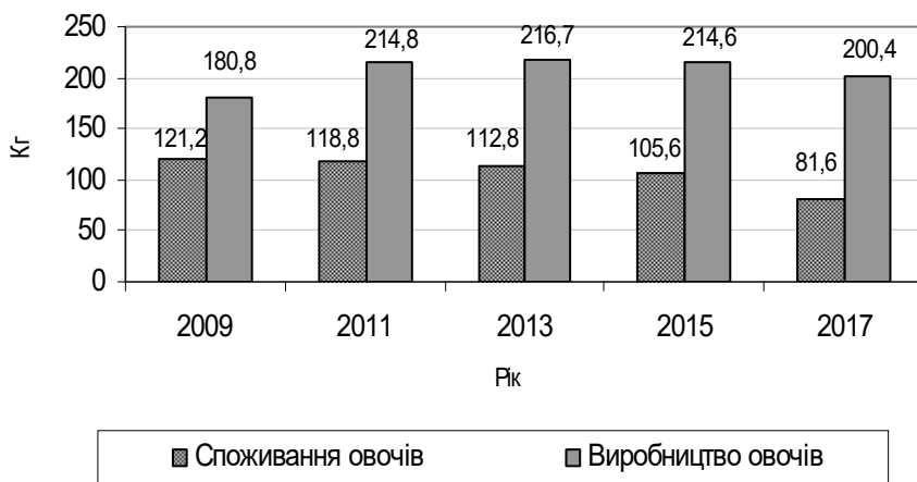
Рис. 1. Виробництво та споживання овочів в Україні з розрахунку на одну особу, кг*

*нобудовано за даними www.ukrstat.gov.ua