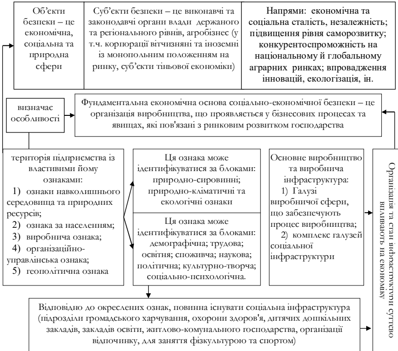
Рис. 1. Складові (елементи) організаційно-економічної безпеки аграрних підприємств

Виділені складові (елементи) організаційно-економічної безпеки аграрних підприємств є основою формування внутрішніх, регіональних, державних і міждержавних відносин, що у сукупності визначають регіональну й національну безпеку країни, на основі взаємозв'язку їх об'єктів [1-2]. Так, внутрішні бізнесові відносини спрямовані на використання внутрішніх ресурсів аграрних підприємств, з метою вдосконалення структури матеріально-сировинного виробництва, розвитку соціальної та виробничої інфраструктури, підвищення фінансово-економічної стійкості, екологічної та соціальної безпеки. При цьому підприємства, що мають умови й ресурси для участі у міжнародному поділі праці, також прагнуть до активізації зовнішньоекономічної діяльності. Це підвищує їх фінансово-економічну стійкість за рахунок валютних надходжень, стимулювання міжнародної торгівлі, притоку новітніх технологій та фінансових інвестицій.