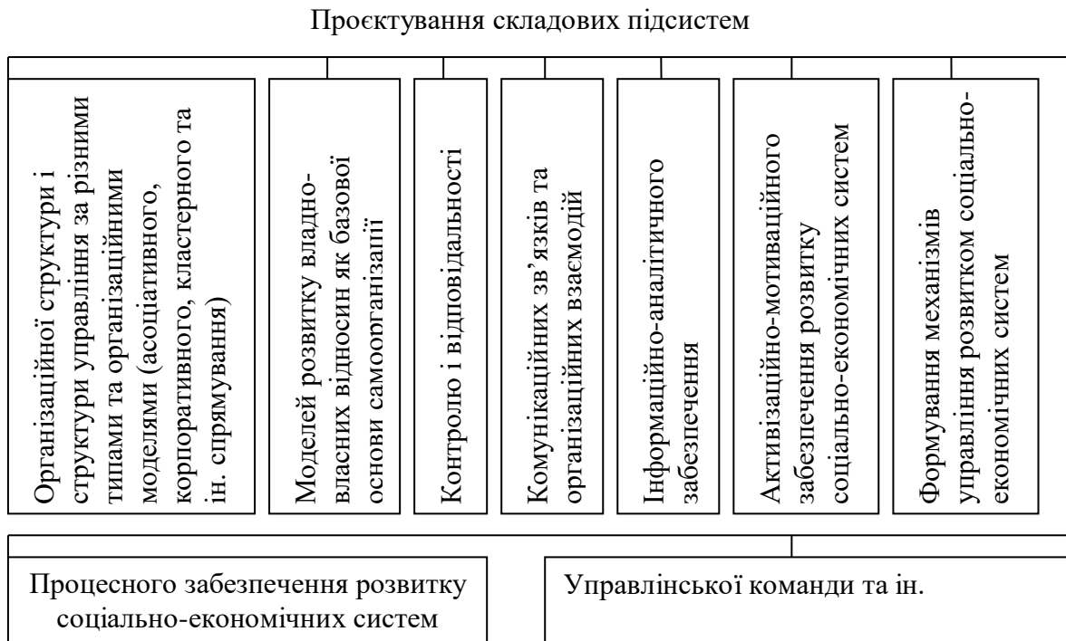
Рис. 2. Основні підходи до проектування результативної системи управління діяльністю підприємств