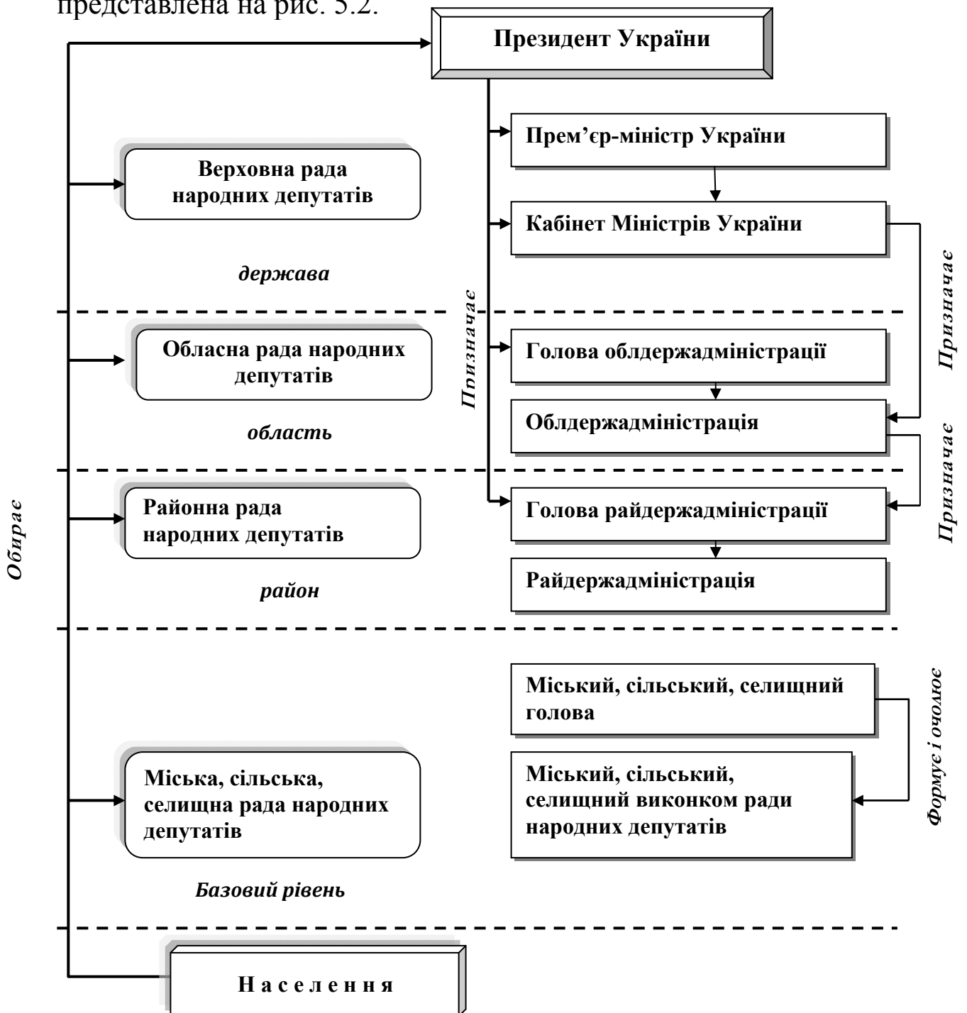
Рис. 5.2. Система місцевої влади в Україні

Державна управлінська вертикаль і органи місцевого самоврядування створюють систему місцевої влади, яка схематично представлена на рис. 5.2.