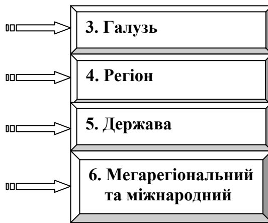
Рис. 12.1. Рівні формування конкурентоспроможності регіону

Активне залучення фахівців різних галузей, рівнів управління, територіальних громад до формування стратегічних планів дозволяє мінімізувати негативний вплив економічних, політичних криз, більш повно та ефективно використовувати наявний ресурсний потенціал регіонів, виявляти і використовувати унікальні конкурентні переваги [18].