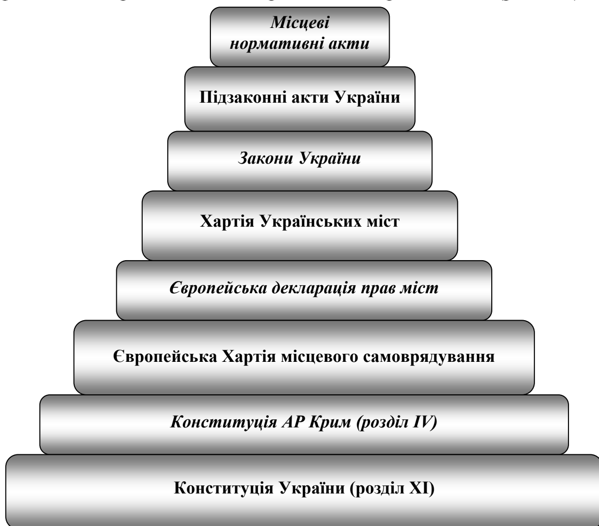
Рис. 5.1. Законодавча база регіонального управління і місцевого самоврядування в Україні

Конституція України, законодавчі акти міжнародного права, ратифіковані в Україні, Закони України, інші правові акти (рис. 5.1).