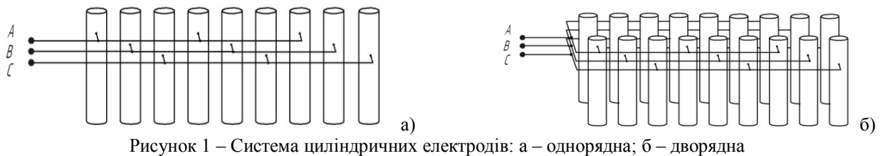
Рисунок 1 – Система циліндричних електродів: а – однорядна; б – дворядна

Для знаходження функції, що конформно відображає верхню півплощину \text{Im } z > 0 на електродну область скористаємось інтегралом Кристоффеля-Шварца, який для області рис. 1а можна записати у вигляді: