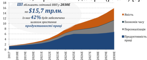
Рис. 1. Оцінка впливу штучного інтелекту на світовий ВВП, трлн дол.

Аналітики компаній McKinsey і Accenture прогнозують, що до 2025 року Інтернет речей принесе світовій економіці від 4 до 11 трильйонів доларів щорічно. Промисловий інтернет речей, своєю чергою, до 2030 року збільшить світовий ВВП на 14 трильйонів доларів. А штучний інтелект, за прогнозами PWC, до 2030 року збільшить світовий ВВП на 15,7 трильйонів доларів (рис. 1.) [3].