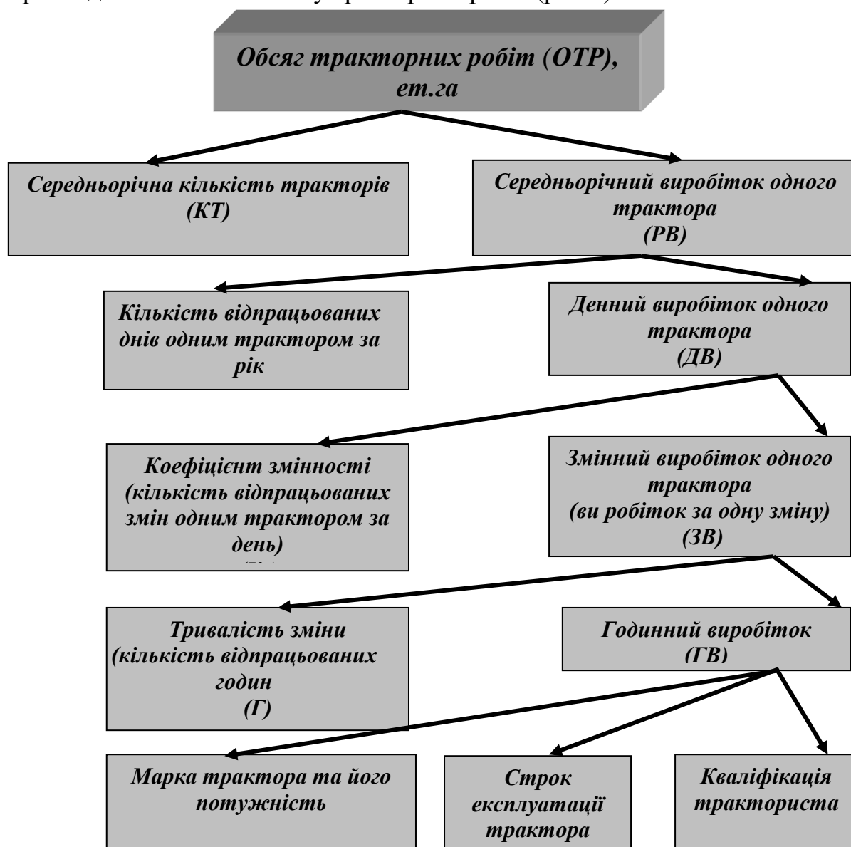
Рис. 1. Схема системи обсягу тракторних робіт

Розглянемо систематизацію факторів в економічному аналізі на прикладі визначення обсягу тракторних робіт (рис.1).