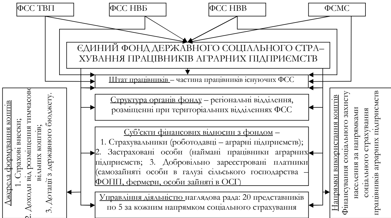
Рис. 1. Організаційна структура пропонованого Єдиного фонду державного соціального страхування працівників аграрних підприємств