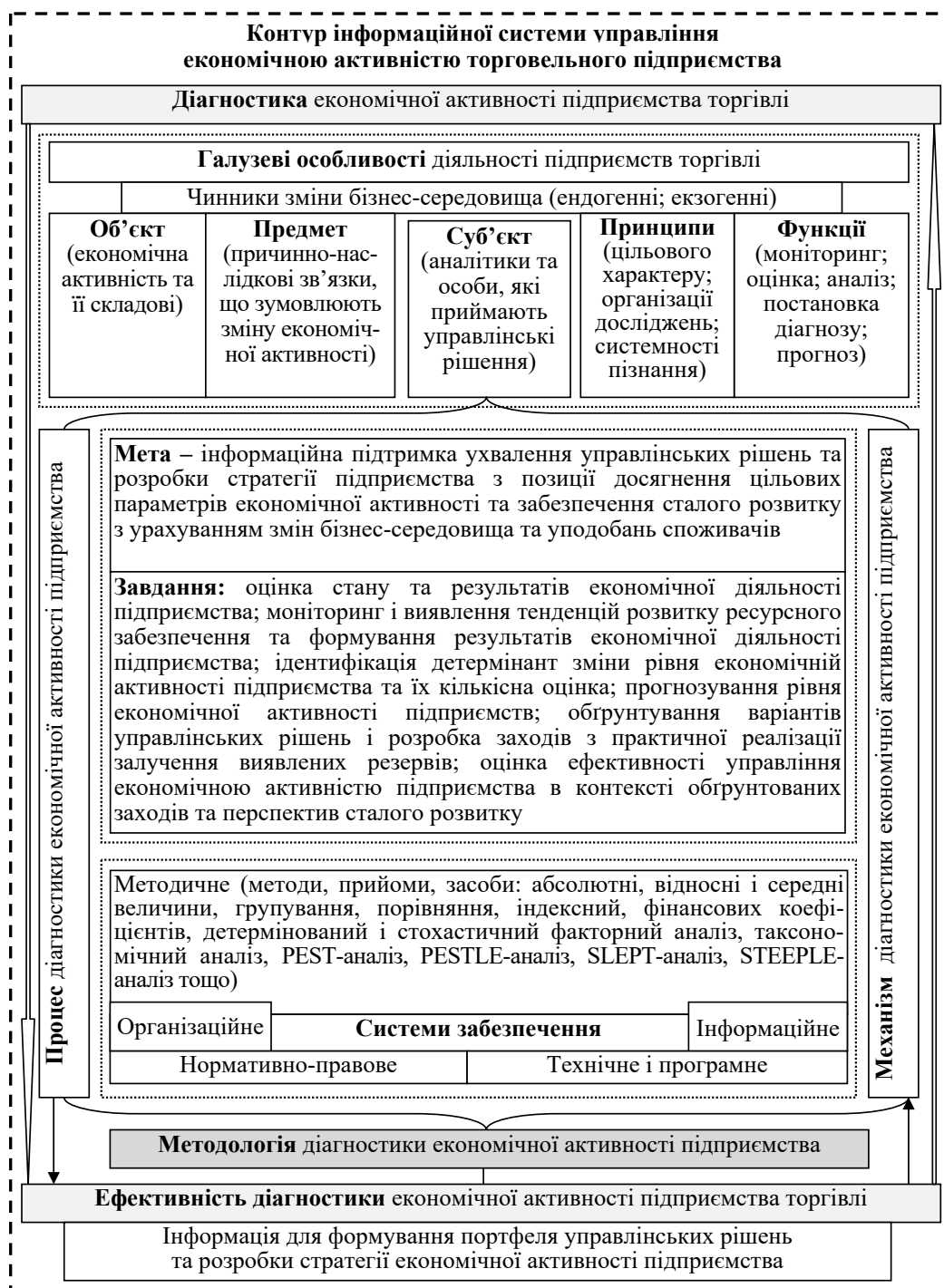
Рис. 3. Концептуальна модель методологічної платформи діагностики економічної активності підприємств торгівлі

Визначена послідовність етапів діагностичного процесу регламентується відповідним механізмом. Механізм діагностики економічної активності торговельного підприємства «є складною системною категорією, яка в широкому сенсі представляє собою систему взаємопов'язаних і взаємозалежних організаційних, економічних, технологічних і методологічних елемен-